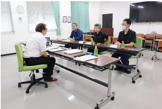
インタビュー（トップ）