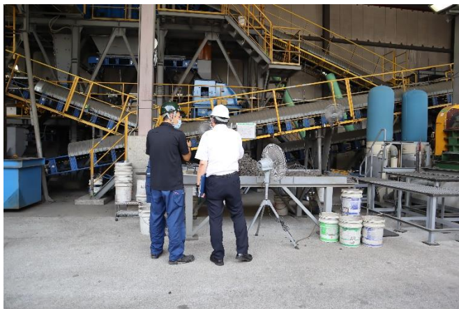
人工砂加工施設審査