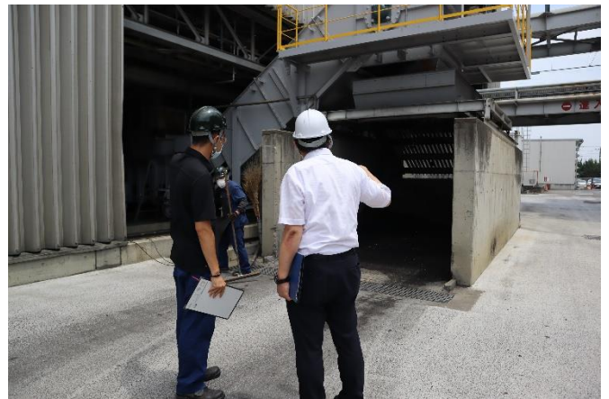
スラグ排出口審査